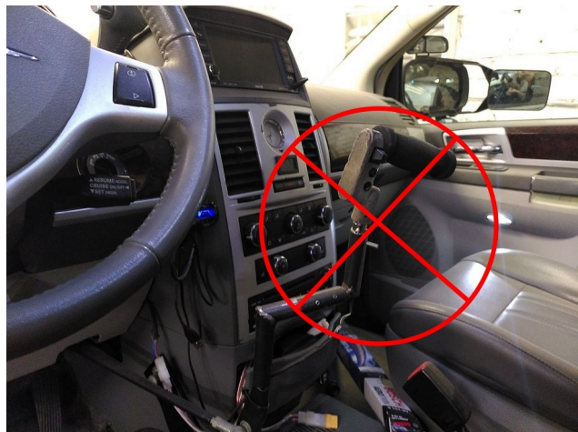
4. pav.: nenaudoti rankenos