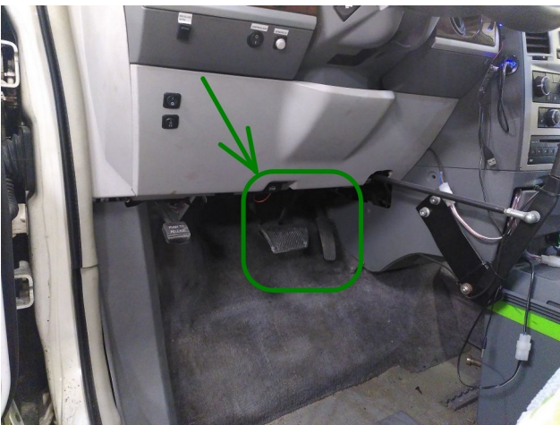
3. pav.: naudoti gamyklinius pedalus