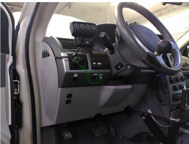
1. pav.: pedalų aktyvavimo mygtukas